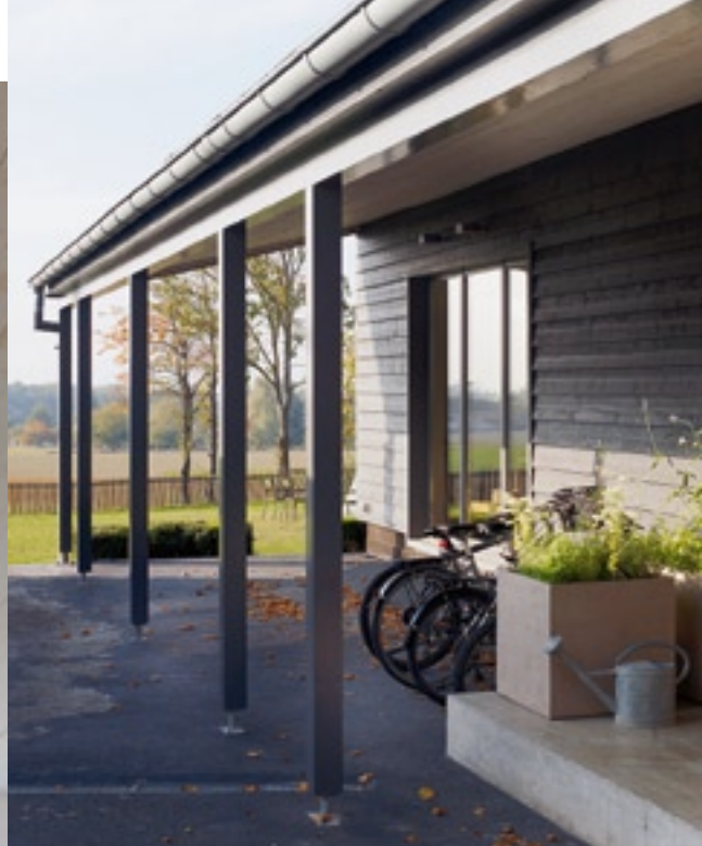
Schirme für Velo & Co.: Ein breites Vordach schützt den Eingangsbereich